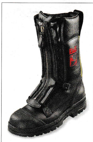
Premium: Neuestes Produkt aus Eisleben ist der Feuerwehrtiefel Premium XL, der auf der Interschutz vorgestellt wurde.

Mit hochwertigen Feuerwehrtiefeln und Sicherheitsschuhen arbeitete sich EWS in den Kreis der fünf führenden Hersteller von Feuerwehrtiefeln in Europa. Nun feierte das Unternehmen sein 70-jähriges Jubiläum.