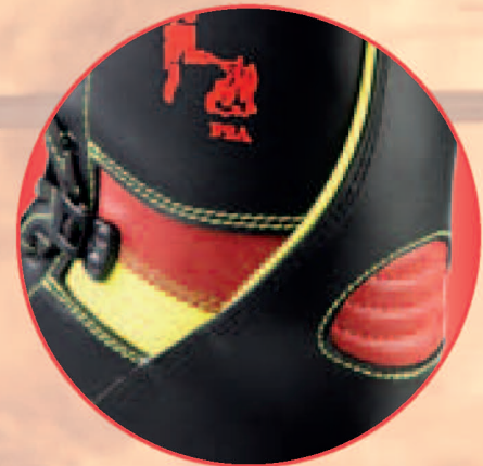
EWS „Comfort Flex“ System